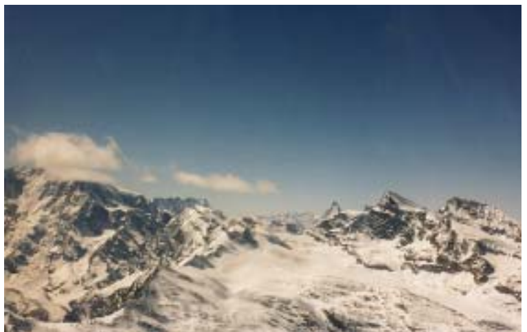
Im Gebiet der Monte Rosa

Der Weiterflug gestaltete sich allerdings knifflig, da einerseits die Sicht durch