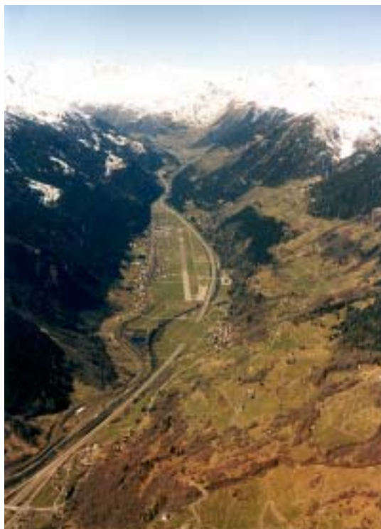
Ambri von Süden

Streckenflüge im Sinn eines Wettbewerbs waren es nicht (immer), da wir meistens nichts ausgeschrieben haben. Trotzdem, eine Aufsummierung der geflogenen Kilometer (Dreieck oder freier Flug um 3 Punkte) ergeben insgesamt 4,100 km. Das ergibt im Schnitt 273 km pro Flug.