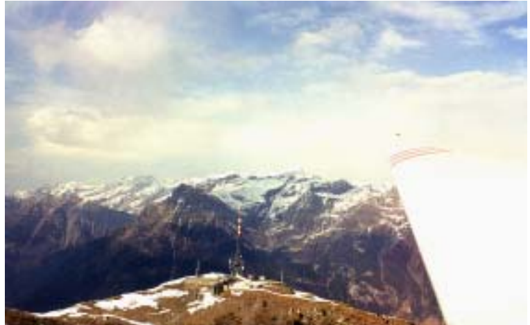
Vorbei am Matro bei Biasca geht's nach Hause

auf 2700 m/M. Dies reichte leider gerade nicht, um nach Norden zu fliegen und direkt Ambri anzusteuern – dies umsomehr als inzwischen eine Abdeckung die Sonne hat verschwinden lassen und wir unterwegs keine sicheren Aufwinde mehr zu erwarten hatten. Es hiess, in den sauren Apfel beissen und den gefahrlosen Umweg entlang der Flugplätze Magadino, San Vittore und Lodrino zu nehmen. Nun, nach einer langen Gleitstrecke hatte der Claro ein Einsehen mit uns. Ein paar Gleitschirme am Hang, die wir beim Anflug ausmachten, versprachen Aufwind. Und tatsächlich, der seine Majestät, der Pizzo di Claro katapultierte uns unter 8/8 Bewölkung anfänglich mit 0.5 und schlussendlich mit 3 m/s auf 2600 mM – eine sehr bequeme Abflughöhe nach Ambri. Vorbei am Matro ging's nun mit Singen und Pfeifen nach Hause.