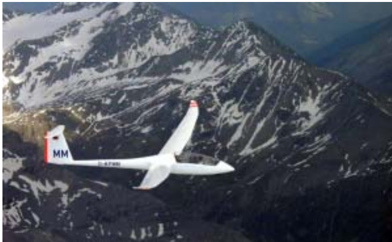
Ein DuoDiscus im Gebirge

lich Flüge, die fast bis Bonneval im Modane-Tal und anschliessend zur Gorge du Verdon führten. Oder der Abstecher vom Glacier Blanc rund um den Barre des Ecrins mit seinen bizarren Gletscherwelten und tiefblauen oder grünen Seen.