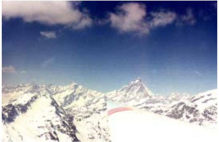
Vorbeiflug am Matterhorn

Auf dem Rückflug hiess es, immer so hoch wie nur möglich den Hängen südlich des Matterhorns und der Monte Rosa entlang zu gleiten. Kreisen war nicht angesagt und hatte meistens nur Höhe gekostet. Es gelang uns auch im Gleitflug, die Höhe bis zur letzten Rippe, die von der Monte Rosa gegen Süden zeigt und uns von Domodossola trennte, zu halten. Sie ist mit ca. 3000 m/M allerdings wirklich hoch und uns fehlten lediglich etwa 100 m zur Überquerung. Eine ausgedehnte Suche nach Aufwinden war erfolglos. Über den Felsen und Gletschern war keine Thermik mehr zu finden. Also hiess es, im engen und gewundenen Tal Richtung Po-Ebene zu fliegen, bis das Überqueren der abfallenden Krete nach Osten möglich wurde und damit einen langen Umweg über unbekanntes Gebiet in Kauf zu nehmen. Ca. 20 km vor Biella war es soweit, dass wir den Sprung über die Krete wagen konnten.